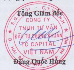
Đặng Quốc Hùng