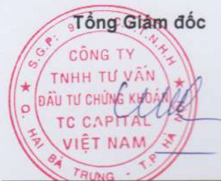
Đặng Quốc Hùng