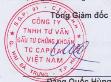
Đặng Quốc Hùng